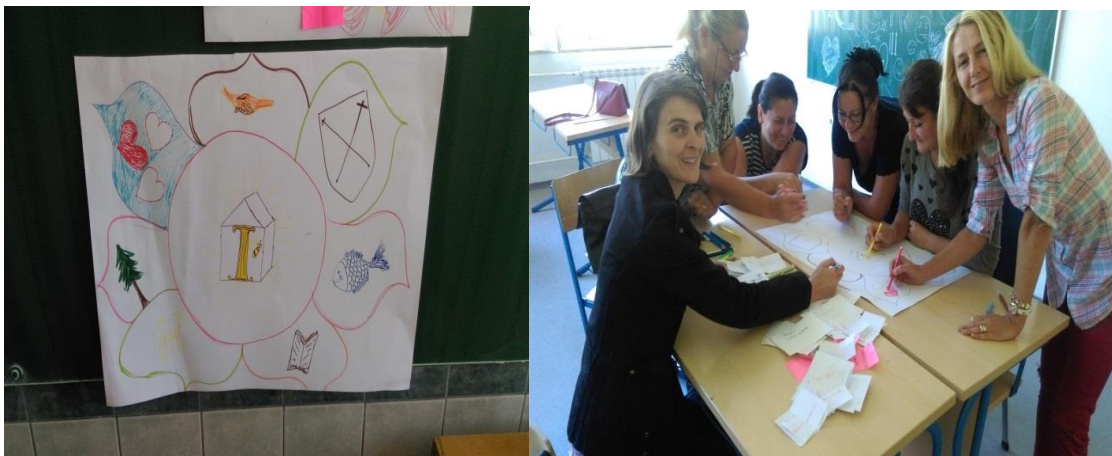
Радионица: Археолози и пропагандисти

Семинар је одржан како би се наставници оснажили и развили компетенције за реализацију радионица и тематско повезивање у настави. Циљ програма који ће наставници реализовати је развијање емоционалне интелигенције и смањење насиља у школи.