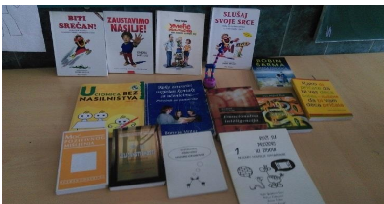
Изложба књига ненасилне комуникације (ННК)

Учесницима семинара додељена су сведочанства.